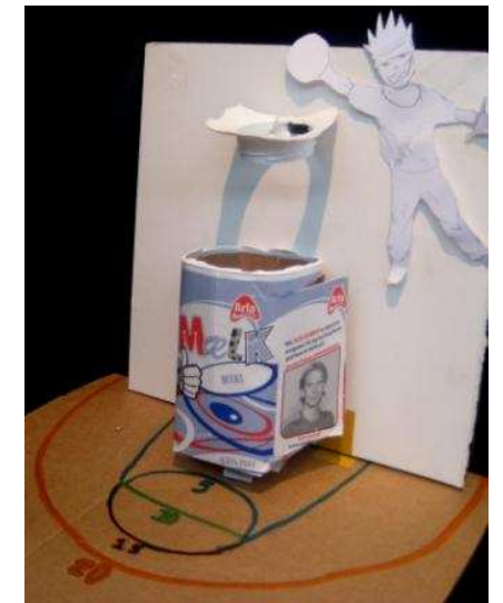
Når unge mennesker inddrages i løsningen af et boligområdes affaldsproblemer blomstrer kreativiteten og de tager ansvar. Her med skraldespand som en basketkurv

Man skønner at ca. 1/3 del af vandforbruget er opvarmet vand. Som tommelfingerregel siger man at det varme vand er ca. dobbelt så dyrt som det kolde vand. Tallet i parentes angiver således den skønnede reelle regning for 1 m 3 vand.