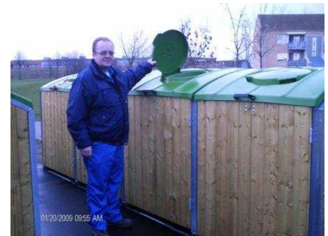
Beboerne i Torstorp vil godt gå i front for hvad angår kildesortering - men får de lov?

Frem til at Teknisk Udvalg igen skal behandle spørgsmålet igen vil der blive gennemført forskellige undersøgelser. Hvornår spørgsmålet igen kommer for politikerne vides ikke.