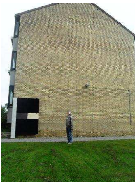
På denne og tre andre gavle vil der være opsat solceller inden for 1/2 år

har nemlig ønsket at få det finansieret via Landsbyggefondens dispositionsfond. Alle almene boligforeninger bidrager til denne fond. (forts. s. 2)